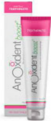
AnOxidant boost Pasta de Dientes 75ml