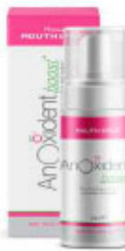
AnOxidant boost Spray Oral 300ml