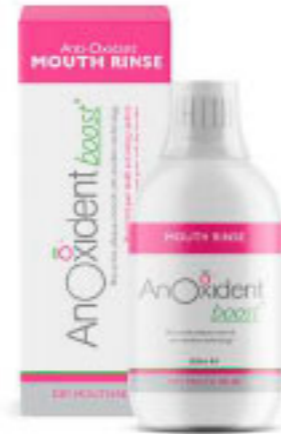
AnOxidant boost Elixir Oral 300ml