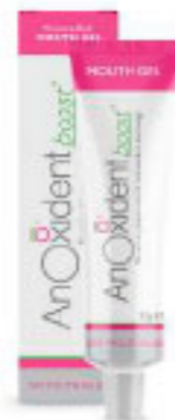
AnOxidant boost Gel Oral 50g